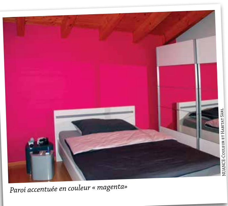
Paroi accentuée en couleur «magenta»