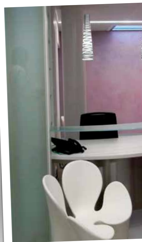
Réception dans un cabinet médical Murs : enduit à la chaux