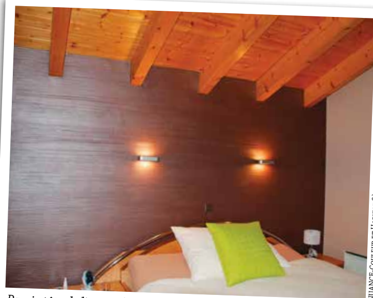
Paroi «tête de lit»: enduit minérale modelé et brossé, finition avec peinture nacrée en couleur «brun chocolat»