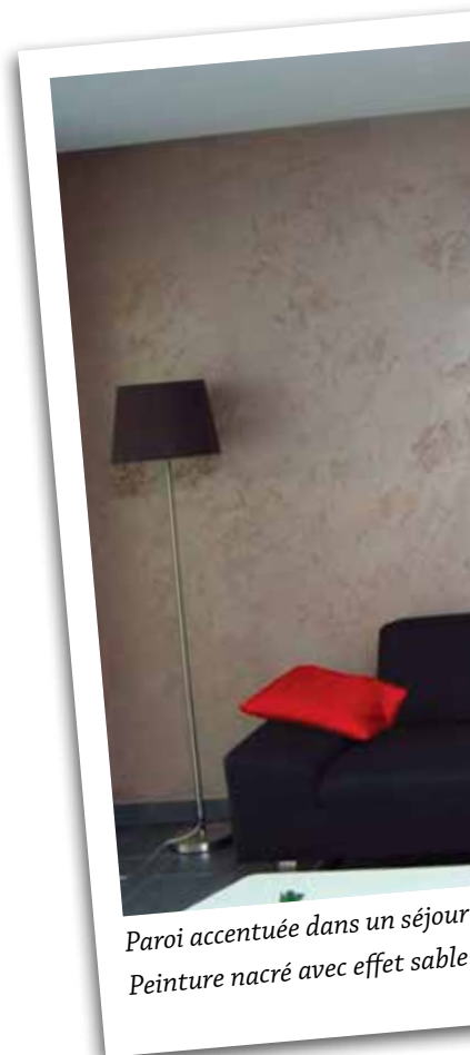
Paroi accentuée dans un séjour Peinture nacré avec effet sable

existe aujourd'hui des peintures mates qui possèdent une remarquable résistance aux frottements. La norme EN 13.300 classe les peintures murales en fonction de leur résistance à l'abrasion humide et évalue la tenue du film de peinture après des cycles de lavage répétés. La norme prévoit 5 classes et avoir recours à des peintures de la classe 1 représente pour le donneur d'ordre une réelle valeur ajoutée en terme de longévité et de durabilité. A noter que la plupart des fabricants font référence, sur leur fiche technique, à la norme EN 13.300