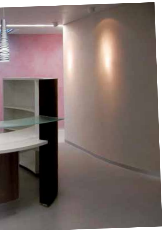
NUANCE-COULEUR ET HABITAT SÀRL